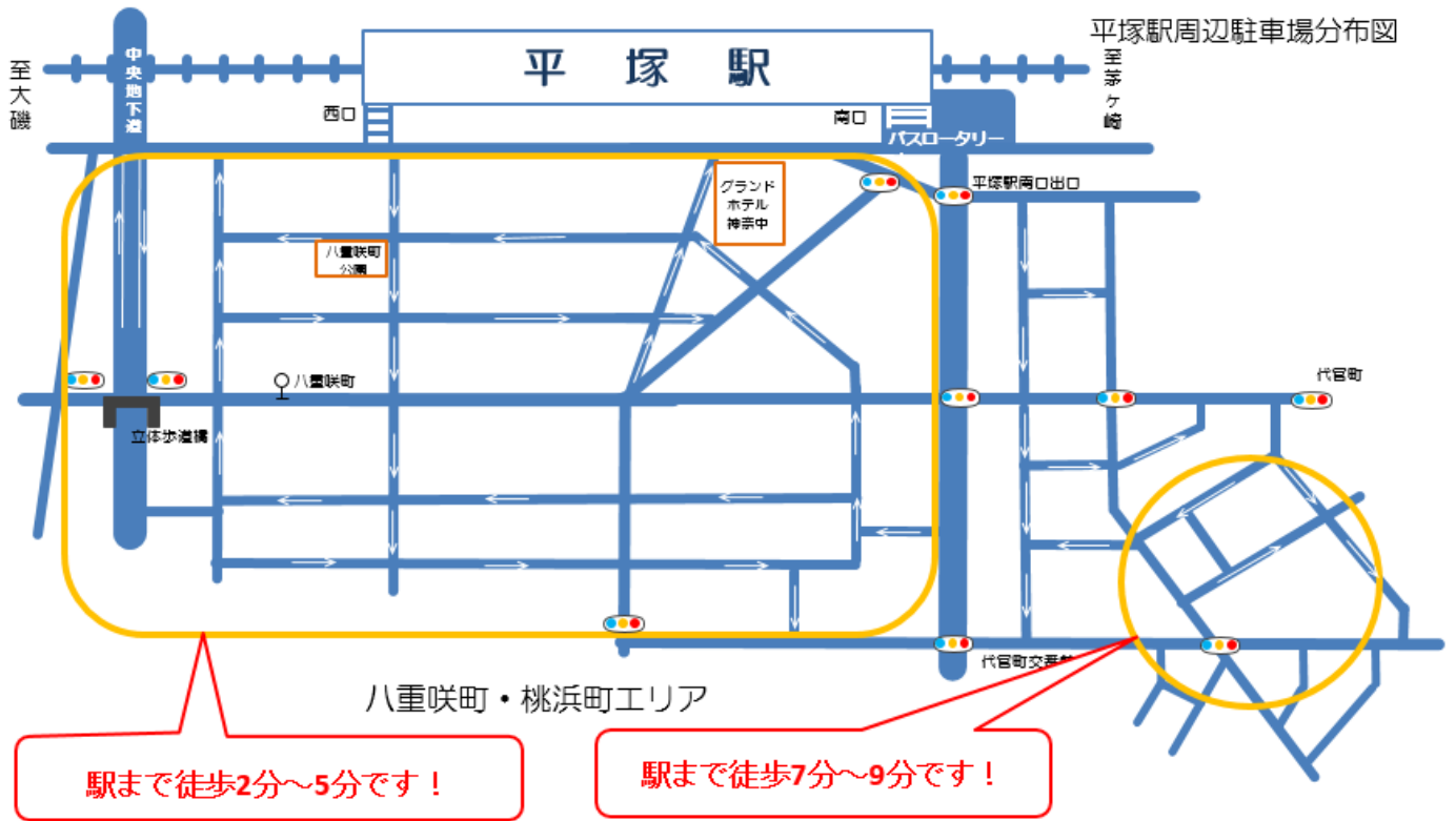
平塚駅周辺駐車場分布図