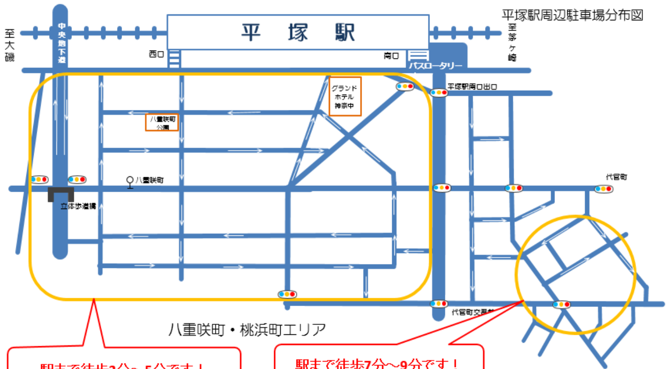
平塚駅周辺駐車場分布図