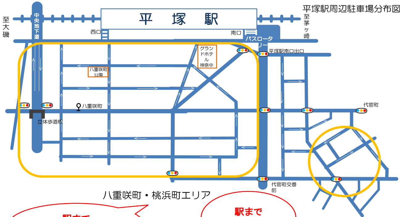
平塚駅周辺駐車場分布図