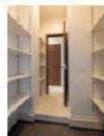
シューズインクロー (ウォークスルータイプ)