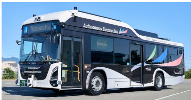
特別展示車両「エルガEV 自動運転バス」

当日は、平塚市およびいすゞ自動車株式会社の協力により、市内で実証運行を行う「エルガEV 自動運転バス」の展示をはじめ、来場者の皆さまにお楽しみいただけるフォトスポットや特別仕様の限定 LED 行先表示、湘南ベルマーレとコラボしたオリジナルバス停など多彩な企画を展開します。