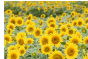
座間市ひまわり畑