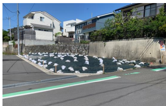
現地写真(2024年5月撮影)